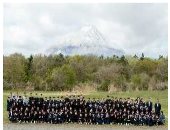
3年生 修学旅行 富士山と