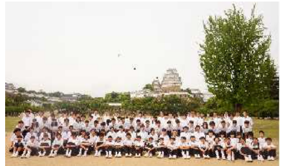
1年生 姫路校外学習 姫路城をバックに

行事を通してできたクラスの絆をこれからの学校生活でさらに深めていけるとよいと思います。