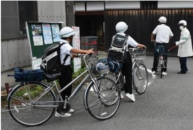
揖保川の土手沿いの道を河内方面から自転車である場合、左側通行をしながら白線に沿って上の写真のように一旦回り込み、その先の道路の手前で一時停止、左右を確認してから横断し左側通行をして

たつの警察署交通課の警察官より、大蔵サイクル店南側のY字路付近にて交通指導をしていただきました。8月から実施していますが、危険な箇所を中心に今後も月1回のペースで実施する予定です。