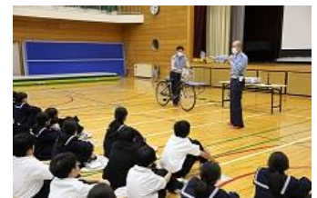
左下：3年税の授業 右下：交通安全教室